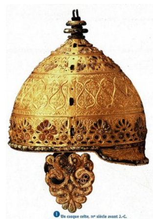
1. Un casque celte, 1 er siècle avant J.-C.