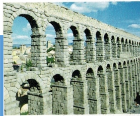
Aqueduc romain de Ségovie (Espagne).