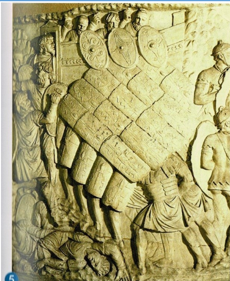
5 Légion romaine à l'assaut d'une ville.