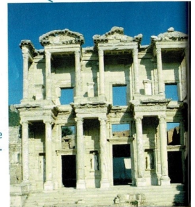
Bibliothèque romaine à Éphèse (Turquie).