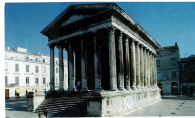
Temple romain à Nîmes (France).

Leur armée est nombreuse, organisée et puissante.