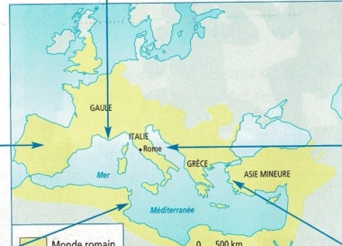
4 La Méditerranée au 1 er siècle après J.-C.