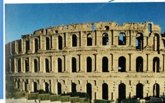
Amphithéâtre romain à el-Djem (Tunisie).